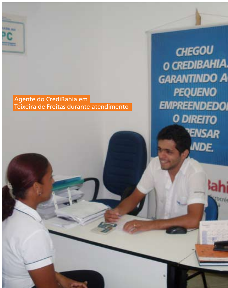
Agente do CrediBahia em Teixeira de Freitas durante atendimento

A profissão foi incluída na família ocupacional Agentes, Assistentes e Auxiliares Administrativos, código 4110, ocupação 4110-50: "Agente de Microcrédito", alcançando a denominação: Agente de microfinanças; Assessor de microcrédito; Assessor de microfinanças e Coordenador de microcrédito.