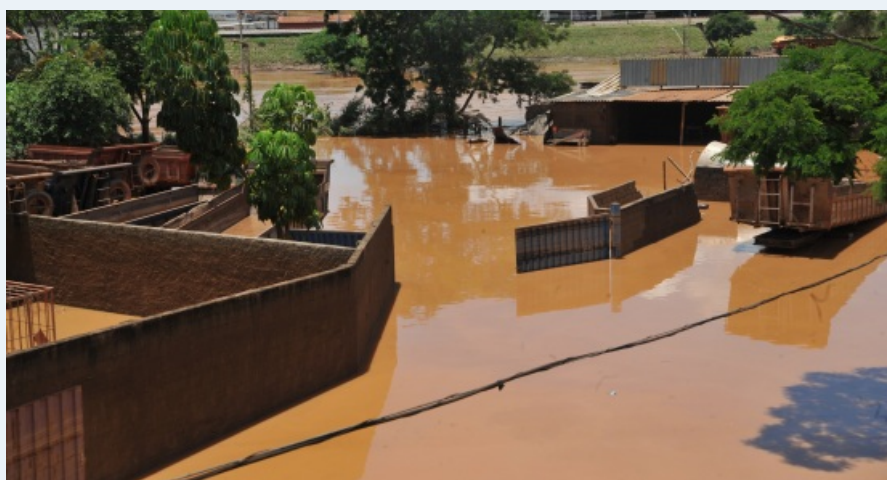
Brumadinho, em Minas Gerais, é um dos municípios atingidos pela chuva deste verão

Além da liberação dos recursos das linhas emergenciais e dos fundos, outras ações foram implementadas pelos associados da ABDE para ajudar na recuperação das atividades produtivas locais. O Banco