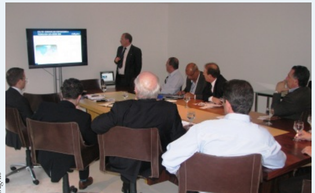
Dimaggio / Bandes